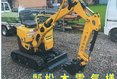
株式会社 松本電気様