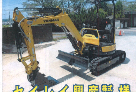
セイレイ興産株式会社様