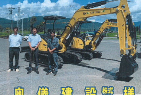
奥儀建設株式会社様