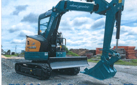
株式会社 近江ジオテック様