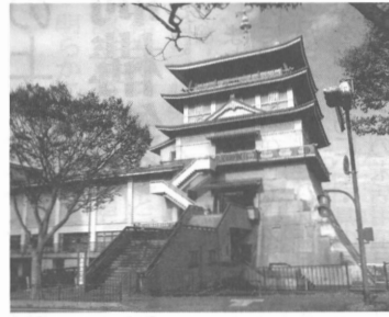
08年(平成20年)から休館している県立琵琶湖文化会館

PFI導入なども検討 機能継承 検討懇 整備方針案は1月にも 滋賀県 策定からPFI導入などを検討し、7年後の開館を目指す。県立琵琶湖文化会館(大津市打出浜)は、1961年(昭和36年)に地上5階(外観は3階)地下1階建延床面積4793平方メートル、展示室床面積908平方メートル、連絡館2階展示室215平方メートル、別館2階展示室241平方メートル、本館3階展